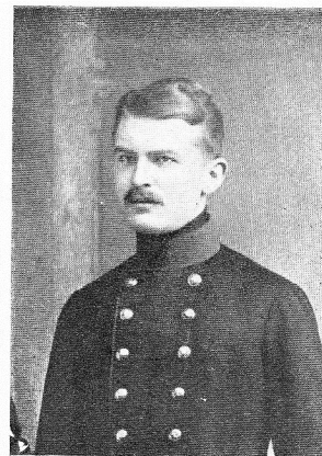
LERAT, Auguste, né le 6 août 1892, à Mons. Médecin adjoint, 6 e lanciers. Frappé mortellement par un éclat d'obus, le 12 août 1914, tandis qu'il soignait des blessés sur le champ de bataille, à Haelen. Transporté dans une chaumière, celle-ci fut incendiée par les obus et le corps fut carbonisé.